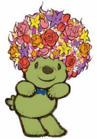
マスコットキャラクター 「ガーデンベア」 © ITOON/GN