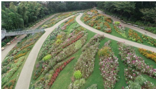
<2019年 秋の里山ガーデンフェスタの大花壇>