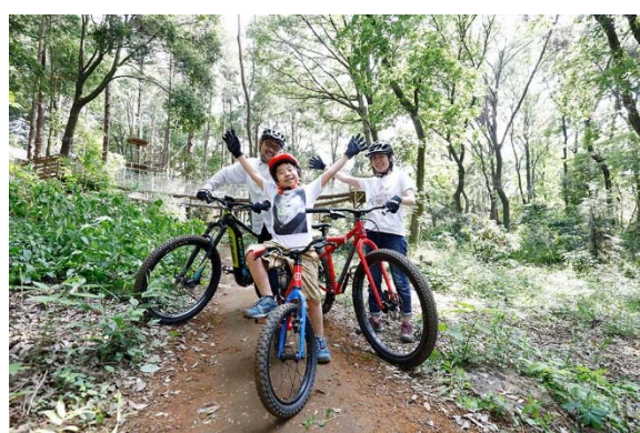
＜トレイルアドベンチャー・よこはま＞