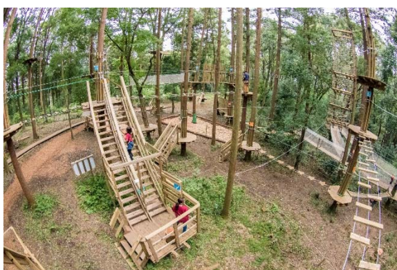
＜フォレストアドベンチャー・よこはま＞

里山ガーデン内にある、市内初のPark-PFIを活用して整備された「フォレストアドベンチャー・よこはま」は9月14日でオープン1周年を迎えます。また、令和2年2月29日（土）には「トレイルアドベンチャー・よこはま」もオープンしています。里山ガーデンフェスタに併せて、是非ご利用ください。（※事前予約制の有料施設です）