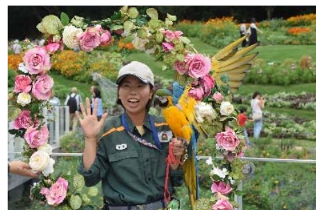
<ズーラシアバードショーPR>