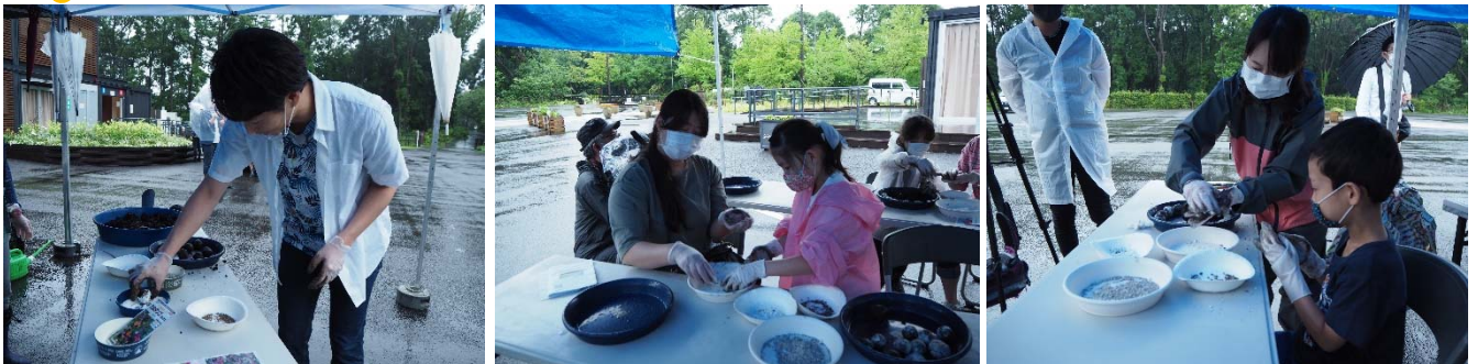
<2020年7月18日 たねダンゴ作りの様子>

市民の皆様とたねダンゴを作りました。 ウェルカムガーデンに植えつけし、綺麗に育った花々が皆様をお迎えします。