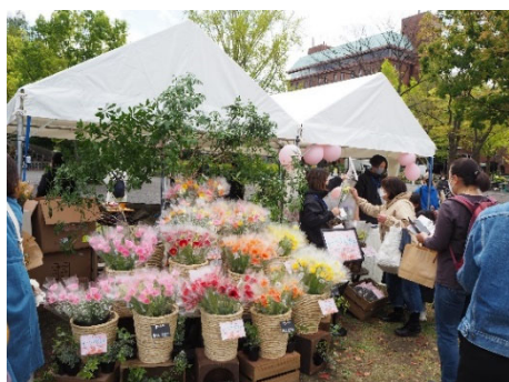
花や緑に親しむ企画の実施