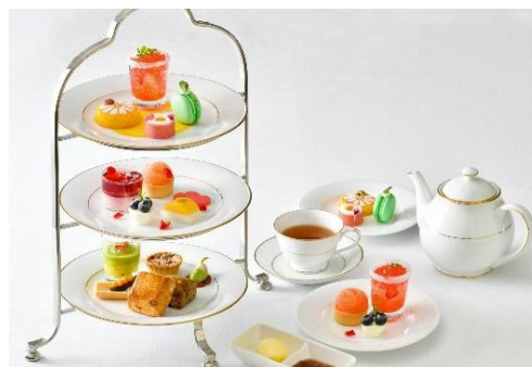
花に関するフォトコンテスト、SNS等を通じた魅力発信、花に関するメニュー提供等