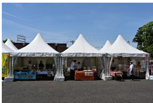
花や緑に親しみ、とりまく環境に目を向ける企画の実施