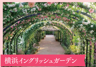
横浜イングリッシュガーデン