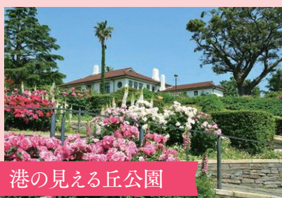
港の見える丘公園