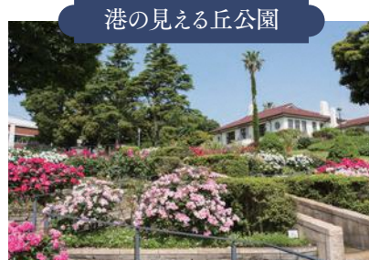
港の見える丘公園