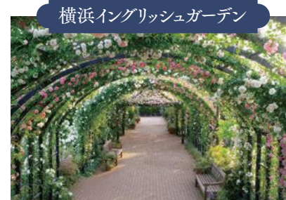
横浜イングリッシュガーデン