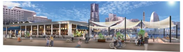
「THE WHARF HOUSE 山下公園」 (イメージ図)