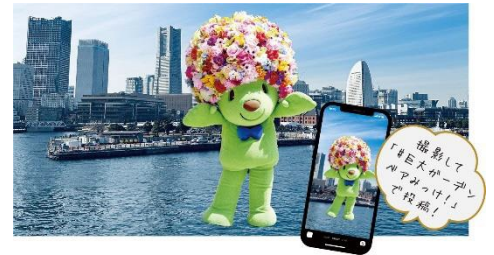
AR 巨大ガーデンベア (イメージ)