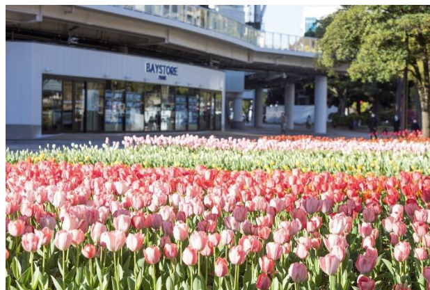
横浜公園 (過去の様子)

横浜市は、横浜の街を舞台に美しい花と緑をネックレスのようにつなぐ「ガーデンネックレス横浜2023」を2023年3月25日(土)から開催しています。本イベントでは、横浜を象徴する港の景観とともに、桜にはじまり、チューリップ、バラ、ユリとリレーするように咲き誇る花々が楽しめます。