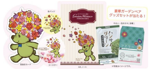
ガーデンベアグッズセット (イメージ)

ご応募はこちらから： https://gardennecklace.city.yokohama.lg.jp/campaign/