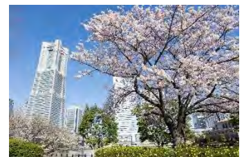
汽車道（過去の様子）

さくら通りや汽車道、山手エリアなどが約300本の桜に彩られます。桜の名所を巡りながら、横浜の春の訪れをお楽しみください。