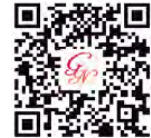
ガーデンネックレス横浜 公式 HP

問合せ先：NTT ハローダイヤル 050-5548-8686（9時～20時／6月10日まで）