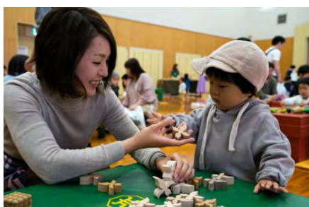
「木育キャラバン」 国産木材の木のおもちゃに触れあえます