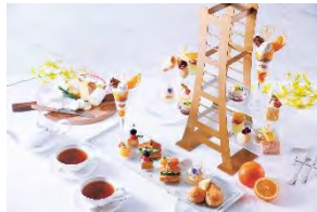
ランドマークアフタヌーンティー 横浜ロイヤルパークホテル