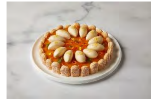
シャルロットタルト オレンジ カモミール ウェスティンホテル横浜