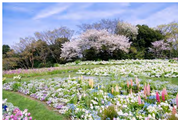
里山ガーデン（過去の様子）

横浜市は、横浜の街を舞台に美しい花と緑をネックレスのようにつなぐ「ガーデンネックレス横浜 2024」を3月23日(土)から6月9日(日)まで開催します。