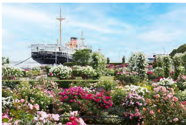
山下公園（過去の様子）