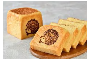
ガーデンベア with キューブリオッシュ ホテルニューグランド