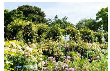
港の見える丘公園「イングリッシュローズの庭」 （過去の様子）

香り・色彩・景色と3つの異なるテーマのバラ園がある港の見える丘公園や、約160品種1,900株のバラの競演が楽しめる山下公園など、横浜市の花である「バラ」は様々な楽しみ方ができます。