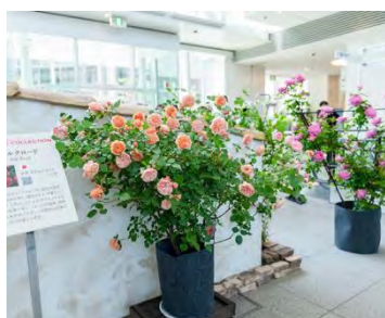
最新品種のバラの展示

新たに日本最大級の園芸イベント「横浜フラワー&ガーデンフェスティバル 2024」を開催します。ショーガーデン展示や花や緑に親しみながら親子で楽しめる体験型ワークショップ、ステージ、ショップなど様々な方にお楽しみいただけるよう多彩なコンテンツをご用意しております。