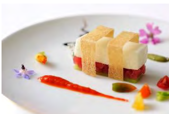
ジャルディニール (横浜食材のお花畑仕立て) レストラン ペタル ドゥ サクラ 7,800 円(税込)からのコースの前菜