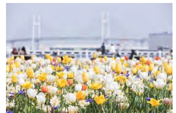
山下公園（過去の様子）

約70種10万本のチューリップが咲き誇る横浜公園、そこから港へ続く日本大通り、潮風を感じながら海や船など港町としての景観が楽しめる新港中央広場など、色鮮やかなチューリップがみなとエリアを彩ります。