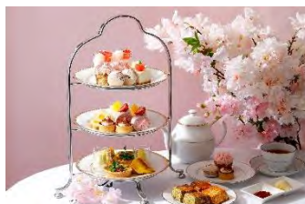
春のアフタヌーンティー ホテルニューグランド ロビーラウンジ「ラ・テラス」 6,704 円(税込)