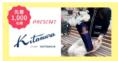
前売券購入の方には先着で「キタムラ」 オリジナルフラワーバッグをプレゼント