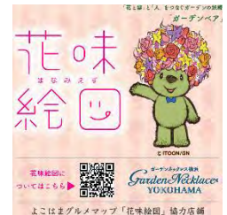
花味絵図参加店舗ステッカー