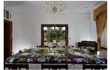
花と器のハーモニー (過去の様子)

横浜山手西洋館を花とテーブルウェアで彩るイベント。22回目を迎える今年は、日本で活躍している外国人フラワーアーティスト等による花のおもてなしと、伝統ある日本各地の器を使用した装飾を展開し、「Rediscovery」をコンセプトに日本を再発見します。