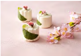
季節のケーキ「SAKU」 ヨコハマグランド インターコンチネンタル ホテル