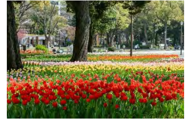
横浜公園 (過去の様子)

10万本を超えるチューリップが広がる横浜公園では、フラワーマーケットを実施するほか、歴史的建造物が建ち並ぶ日本大通りでは、春の花々が街路を彩ります。山下公園では、趣向を凝らした21区画の花壇が並ぶ「花壇展」を開催します。