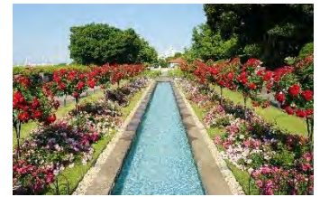
山手イタリア山庭園「バラと輝く噴水の庭」 (過去の様子)

横浜市の花「バラ」の見ごろにあわせて、市内各所のバラ園や、バラがテーマのイベント、スイーツ、カクテル、ショッピングなど、横浜の歴史を感じる街並みや港の風景とともに“バラ”を楽しむ「バラの街歩き」期間です。