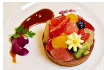
季節のタルト Cafe オンディーヌ 950 円(税込)