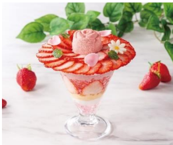
ローズパフェ ローズホテル横浜