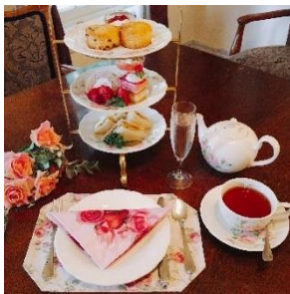
薔薇のアフタヌーンティセット えの木てい 本店