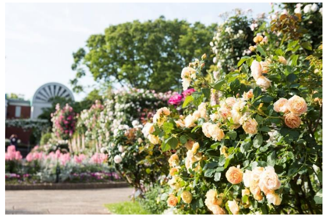
港の見える丘公園「香りの庭」（過去の様子）

4月に最盛期を迎えるチューリップから移り変わり、5月上旬からは横浜市の花“バラ”が見頃を迎え、『はまみらい』や『セント・オブ・ヨコハマ』などの横浜にちなんだバラをはじめ、2,000品種以上の色とりどりのバラが市内各所を彩ります。これらのバラの見頃に合わせて始まる「横浜ローズウィーク」の期間中は、フラダンスショーやガーデンコンサート、ローズマーケットなどのさまざまな催しを展開。また、横浜市内のホテル