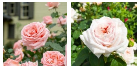
左：はまみらい 右：セント・オブ・ヨコハマ (過去の様子)

4月に最盛期を迎えるチューリップから移り変わり、5月上旬からは横浜市の花“バラ”が見頃を迎え、『はまみらい』や『セント・オブ・ヨコハマ』などの横浜にちなんだバラをはじめ、2,000品種以上の色とりどりのバラが市内各所を彩ります。これらのバラの見頃に合わせて始まる「横浜ローズウィーク」の期間中は、フラダンスショーやガーデンコンサート、ローズマーケットなどのさまざまな催しを展開。また、横浜市内のホテル