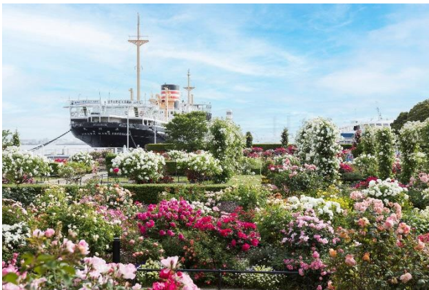
山下公園「未来のバラ園」（過去の様子）

横浜市では、3月23日（土）～6月9日（日）の期間で、横浜の街を舞台に美しい花と緑をネックレスのようにつなぐ「ガーデンネックレス横浜2024」を開催しています。5月3日（金・祝）からは、横浜市の花である“バラ”が最も美しく咲き乱れる期間に、街歩きをしながらバラを楽しむ「横浜ローズウィーク」が始まります。