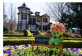
山手イタリア山庭園

「ガーデンネックレス横浜2024」の期間中、みなとエリアの各所には、横浜の街を背景にガーデンベアと一緒に写真が撮れるフォトスポットを多数設置しています。「横浜ローズウィーク」の期間に、バラめぐりと併せてお楽しみください。