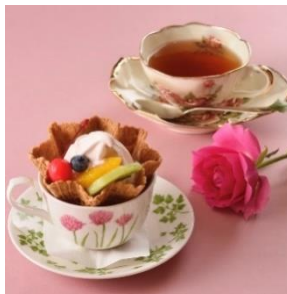
ローズソフトクリーム& ローズティーセット カフェ・ザ・ローズ