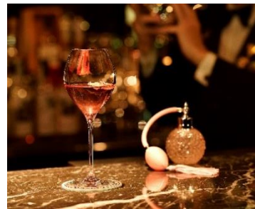
ローズカクテル「ピュアローズ」 ホテルニューグランド