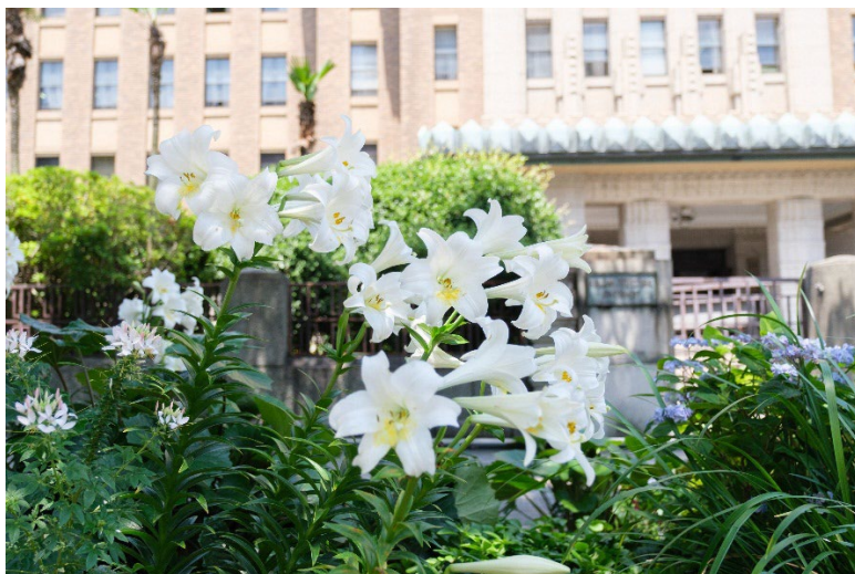
日本大通り（過去の画像）

横浜市は、横浜の街を舞台に美しい花と緑をネックレスのようにつなぐ「ガーデンネックレス横浜2022」を2022年3月26日（土）から6月12日（日）まで開催しています。本イベントでは、横浜を象徴する港の景観とともに、サクラにはじまり、チューリップ、バラ、ユリとリレーするように咲き誇る花々が楽しめます。