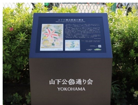
ユリと横浜開港の歴史を記した記念碑。

それらユリと横浜開港の歴史文化を伝えるため、山下公園と並行して走る山下公園通りにヤマユリを植栽するとともに、ユリと横浜開港の歴史を記した記念碑が、2021年4月に山下公園通り会により設置されました。