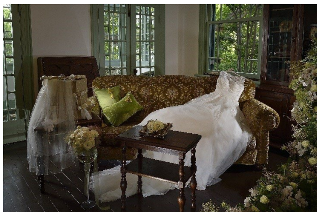
※画像は過去のものになります。