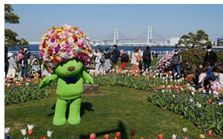
グリーティングの様子（過去の画像）