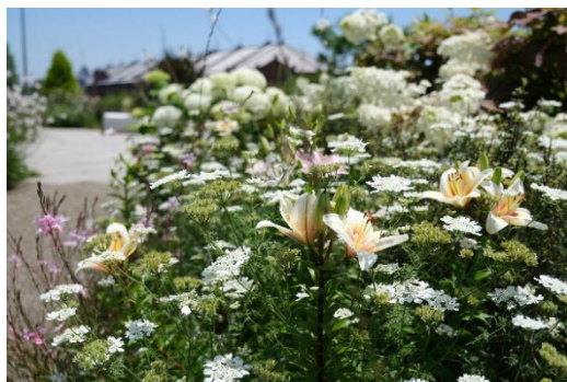
新港中央広場（過去の画像）

また、「ガーデンネックレス横浜」期間中は花に関連したイベントも予定しています。6月4日（土）からは横浜山手西洋館7館を花とテーブルウェアで彩るイベント「花と器のハーモニー2022」を開催します。「山手の丘のウェディング物語～幸せを呼ぶ7つの館のおもてなし～」をテーマに、かつて外国人居留地だった山手の丘に建つ館を装飾します。関連イベントの詳細については「ガーデンネックレス横浜2022」公式ホームページからご確認いただけます。