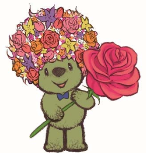
マスコットキャラクター 「ガーデンベア」