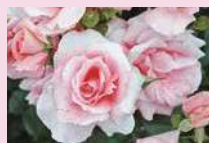
プリンセス・アイコ (F)