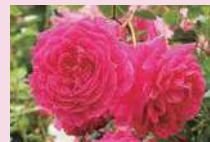
グルス・アン・テブリッツ (Ch)