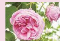
ロサ・ケンティフォーリア (C)