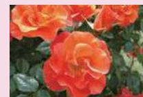
プリンセス・ミチコ (F)