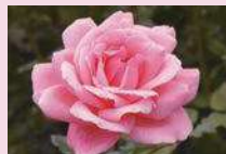
クイーン・エリザベス (Gr)