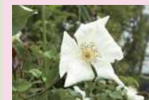
ロサ・ギガンテア (Sp)