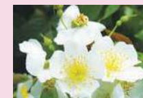
ロサ・モスカータ (Sp)