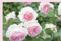
ピエール・ドゥ・ロンサル (CL)