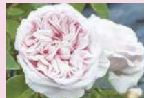
スヴェニールドゥ・ラ・マルメゾン (B)