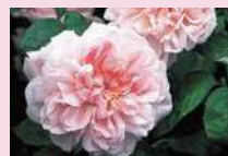
エグランタイン/マサコ (S)