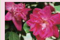
ロサ・キネンシス (Sp)