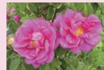
ロサ・ガリカ・オフィキナーリス (Sp)