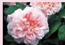
エグランタイン/マサコ (S)