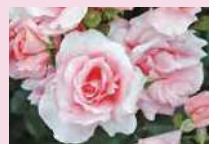
プリンセス・アイコ (F)