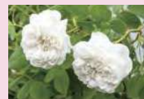
マダム・アルディ (D)