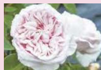
スガニールドゥ・ラ・マルメゾン (B)