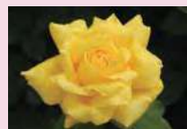
ローズ・ヨコハマ (HT)