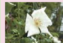
ロサ・ギガンテア (Sp)