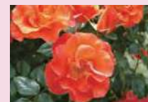
プリンセス・ミチコ (F)