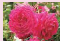
グルス・アン・テブリッツ (Ch)