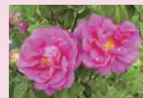
ロサ・ガリカ・オフィキナーリス (Sp)