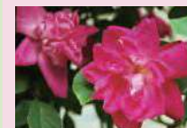
ロサ・キネンシス (Sp)