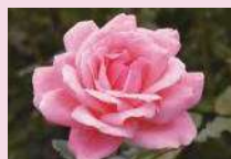
クイーン・エリザベス (Gr)