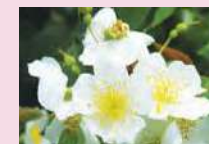
ロサ・モスカータ (Sp)