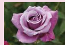
シャルル・ドゥ・ゴール (HT)