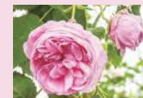
ロサ・ケンティフォーリア (C)